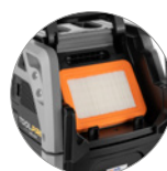
Flachfilter aus PTFE