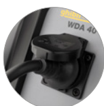
Anschluss von Elektrowerkzeugen