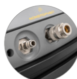
Kit COMBI (opt.)