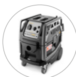
Kompakt und handlich