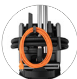
Haken für Zubehör und Kabelhalterung