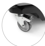
Lenkrollen mit Bremsen