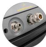
Комплект COMBI (опционально)