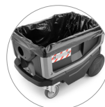
Фильтр-мешок из PE (опция)