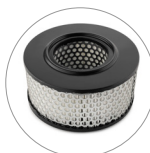
Картриджный фильтр HEPA