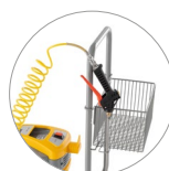
Cestino portaoggetti con alloggiamento lancia erogatrice