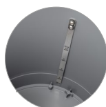
Serbatoio soluzione detergente con scala graduata