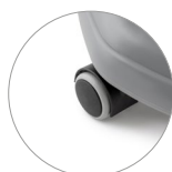
Ruote anteriori pivottanti