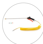
Tubo estensibile a spirale, lancia erogatrice, ugelli