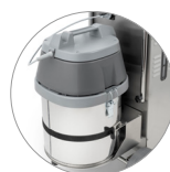
Moteur aspiration de grande puissance (V)