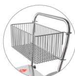
Chariot avec porte accessoires