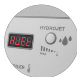
Fonction Hydrojet (H)