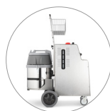
Châssis solide en acier inox