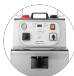
Commande panneau muni d'écran et manomètre