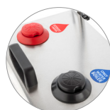
Réservoirs eau et solution nettoyante