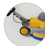
Шарнирное крепление рукоятки