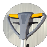
Рукоятка вид спереди