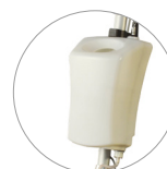
Бак 12 литров (опция)