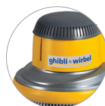
Новая пластиковая крышка (L 22)