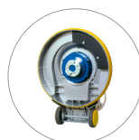
Система крепления приводного диска и щетки