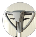
Рукоятка вид сзади