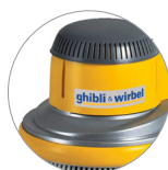
Nuova cover in plastica (L22)