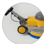
Snodo del manico