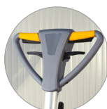
Impugnatura vista fronte