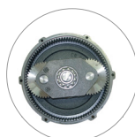
Riduttore a satelliti e planetario (L22)