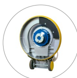
Attacco disco trascinatore e spazzole