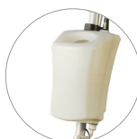
Serbatoio 12 litri