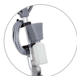
Système d'injection électrique