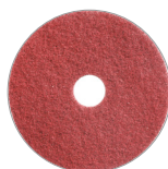
Différents types de pads