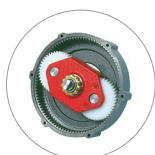
Réducteur à satellites et planétaire (M16)