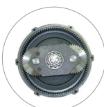
Réducteur à satellites et planétaire (M22)