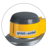
Nouveau couvercle en plastique (M22)