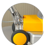
Articulation du manche