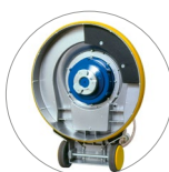
Raccord plateau entraîneur et brosses