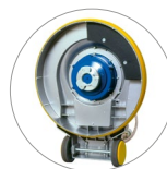
Scheiben und Bürstenanschluss