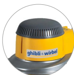
Neue Kunststoff- Abdeckung (M22)