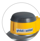
Новая пластиковая крышка (L 22)