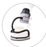
Комплект для удаления пыли (опция)