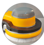
Возможность использования дополнительного утяжелителя (опция)