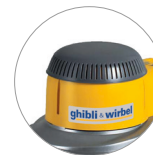
Nueva cubierta de plástico (L22)