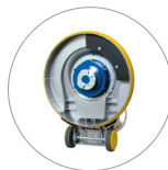
Ataque para porta pads y cepillos