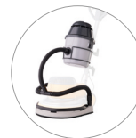
Kit de succión (opcional)