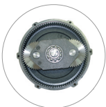
Engranaje planetario (L22)