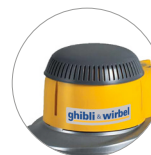
Nueva cubierta de plástico (L22)