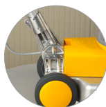
Articulación de la palanca