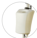
Depósito de 12 l