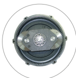
Engranaje planetario (L22)