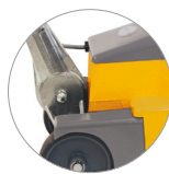
Articulación de la palanca