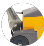
Articulación de la palanca