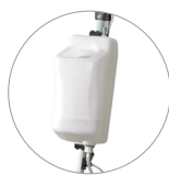
Depósito de 9 l