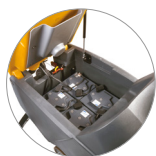
Бак для грязной воды с газовой пружиной