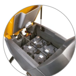
Serbatoio recupero con molla a gas