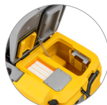
Sammelfilter für große Unreinheiten + Schutzfilter des Saugmotors