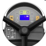
Praktische und intuitive Bedienpult mit Display