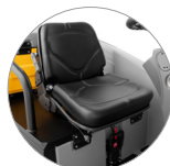
Einstellbarer ergonomischer Sitz