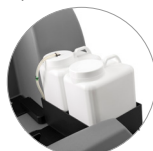
Chemical mixing system