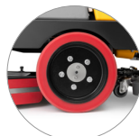
Antrieb an den Hinterrädern (Ausführungen RD)