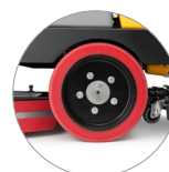
Trazione sulle ruote posteriori (versioni RD)