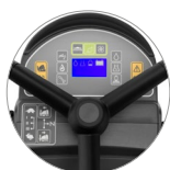
Pannello comandi con display