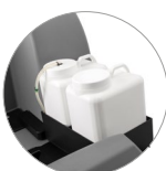
Chemical mixing system