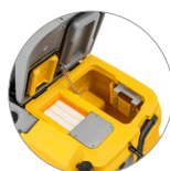
Débris tray + filtre de protection du moteur d'aspiration