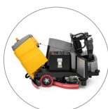
Accès facile à tous les composants