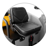
Siège réglable et ergonomique