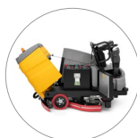
Agile accesso a tutte le componenti