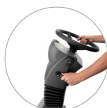
Piantone sterzo regolabile