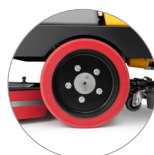
Trazione sulle ruote posteriori (versioni RD)