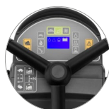
Pannello comandi con display