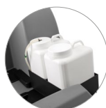
Chemical mixing system