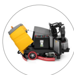
Agile accesso a tutte le componenti