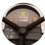
Pannello comandi con display