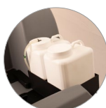
Chemical mixing system