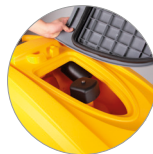
Filtro recogedor de partículas grandes + filtro motor de aspiración