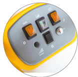
Panel de mandos