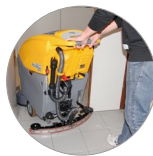
Einstellbarer und kompakter Saugbalken