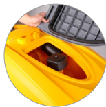
Sammelfilter für große Unreinheiten + Schutzfilter des Saugmotors