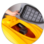
Debris tray + filtro motore aspirazione