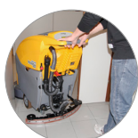
Tergitore regolabile e compatto