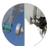
Filtro soluzione a immersione