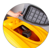
Débris tray + filtre de protection du moteur d'aspiration