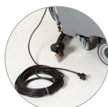
Prolongación del cable 25 m en el equipamiento estándar