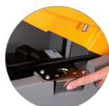
Sistema de depósito abatible