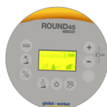
Panneau de commandes avec écran