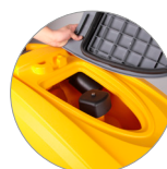
Debris tray + filtre de protection du moteur d'aspiration