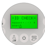
Mot de passe d'accès, praticité et sécurité