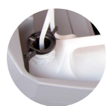
Chemical mixing system