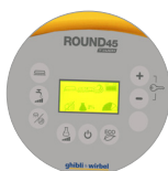
Panel de mandos con pantalla