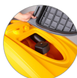
Filtro recogedor de partículas grandes + filtro motor de aspiración