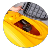
Sammelfilter für große Unreinheiten + Schutzfilter des Saugmotors