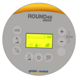
Bedienfeld mit display