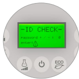
Zugangspasswort, Praktikabilität und Sicherheit