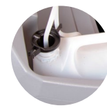
Chemical mixing system