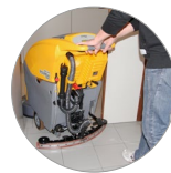
Einstellbarer und kompakter Saugbalken