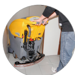
Tergitore regolabile e compatto