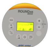
Pannello di controllo con display