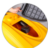
Debris tray + filtro motore aspirazione