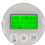
Password utente, praticità e sicurezza