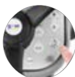
Funzione "Ready to go"