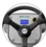
Pannello comandi con display