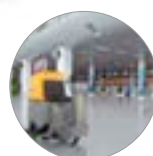
Grande autonomia di lavoro, fino a 7 ore (versione BC PLUS)