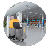
Gran autonomía de trabajo, hasta 7 horas (versión BC PLUS)