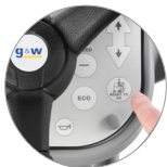
Función "Ready to go"