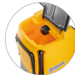
Depósito de recuperación: acceso y limpieza fáciles