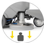
Presión en el suelo extra