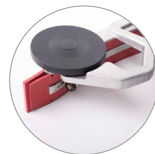
Secador de aluminio