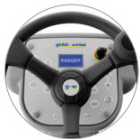
Panel de mandos con pantalla