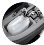
Система дозирования моющего средства