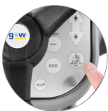
Функция "Ready to go"