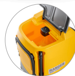
Бак для грязной воды: простой доступ и очистка