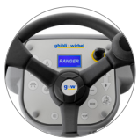
Панель управления с дисплеем