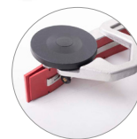
всасывающая балка из алюминия