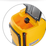
Depósito de recuperación: acceso y limpieza fáciles