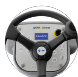
Panel de mandos con pantalla