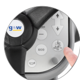
Función "Ready to go"