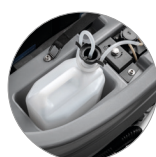
Chemical mixing system