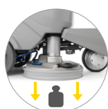
Presión en el suelo extra