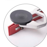
Secador de aluminio