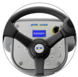
Bedienpult mit Display