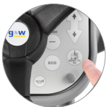
Funktion "Ready to go"