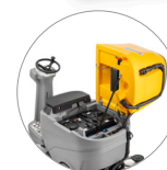
Agile accesso a tutte le componenti