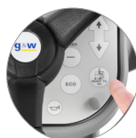
Funzione "Ready to go"