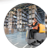
Ergonomia e comfort