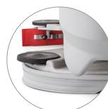
Gruppo testata e tergiture in alluminio