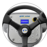
Pannello comandi con display