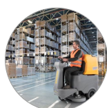
Ergonomia e comfort