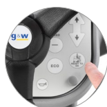
Funzione "Ready to go"