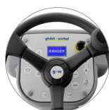
Pannello comandi con display