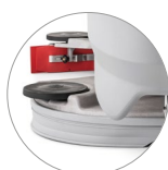
Gruppo testata e tergitore in alluminio