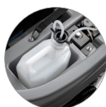
Chemical mixing system