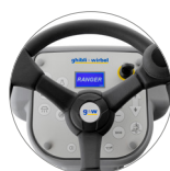
Panel de mandos con pantalla