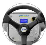
Commande panneau muni d'écran