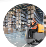
Ergonomie et confort