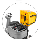
Accès facile à tous les composants