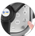
Fonction "Ready to go"