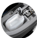
Chemical mixing system