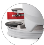
Tête et système d'essuyage en aluminium