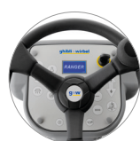
Panel de mandos con pantalla