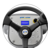
Bedienpult mit Display