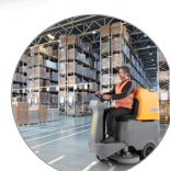
Ergonomie und Komfort