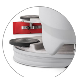
Saugbalken und kopf aus Aluminium