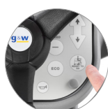
Funktion "Ready to go"