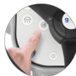
Funktion geräuscharmer Betrieb