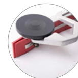
Saugbalken aus Aluminium