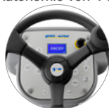
Bedienpult mit Display