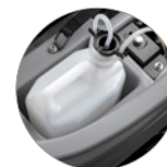
Chemical mixing system (opt.)