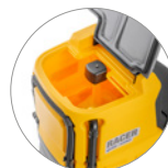
Schmutzwassertank: leicht zugänglich, leicht zu reinigen