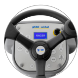
Панель управления с дисплеем