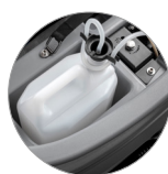
Система дозирования мощного средства (опция)