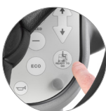
Функция "Ready to go"