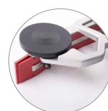
Gruppo tergitore in alluminio