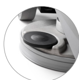
Testata retrattile con paraspruzzi