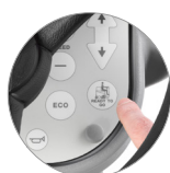
Funzione "Ready to go"