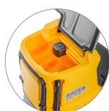
Serbatoio di recupero: facile accesso e pulizia