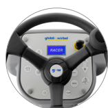
Pannello comandi con display