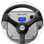
Bedienpult mit Display