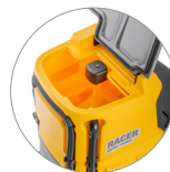
Schmutzwassertank: leicht zugänglich, leicht zu reinigen