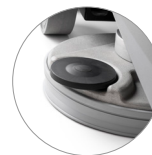
Einziehbarer Kopf mit Spritzschutz