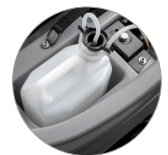
Chemical mixing system