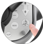
Funktion "Ready to go"