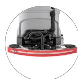
Kompakter Saugbalken mit natürliches gummi