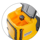
Schmutzwassertank: leicht zugänglich, leicht zu reinigen