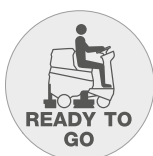
Funktion "Ready to go"