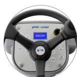
Bedienpult mit Display