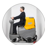
Kompakte Größe, wenig in allen Bereichen