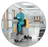
Функция "тихий режим"