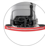
Компактная всасывающая балка с натуральной резины