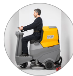
Компактные размеры, великолепная маневренность в ограниченном пространстве