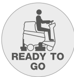
Функция "Ready to go"