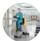
Funzione modalità silenziosa