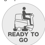
Funzione "Ready to go"