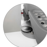
Testata retrattile in alluminio