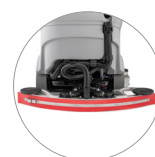
Tergitore compatto con gomme naturali