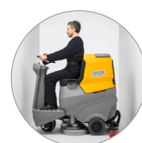
Dimensioni compatte, agili in spazi stretti